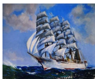
『遙かなる国へ』 上越教育委員会 所蔵