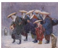
『藝女』 小林古径記念美術館 所蔵