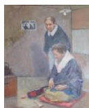
『老いる藝女』 上越文化会館 所蔵