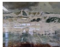
『波濤』 上越市立直江津小学校 所蔵