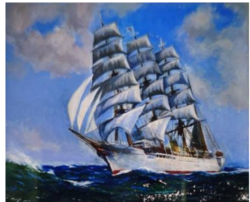
『運かなる国へ』