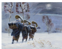
『冬の旅する藝女』 小林古径記念美術館 所蔵