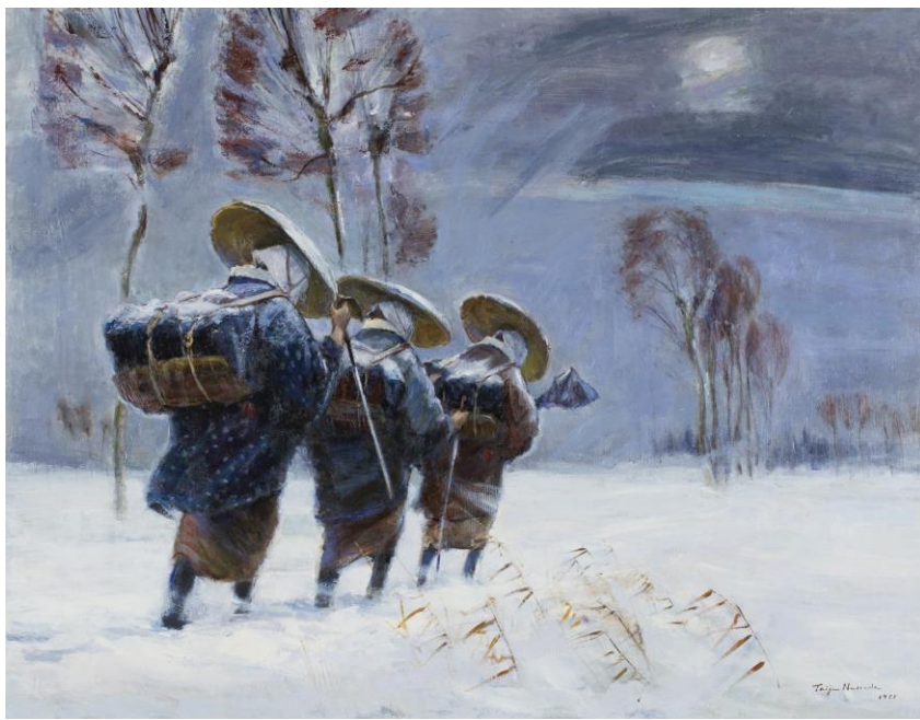
『冬の旅する藝女』小林古径記念美術館 所蔵