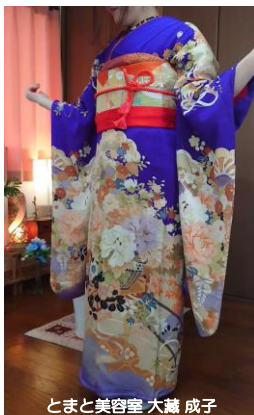
とまと美容室 大藏 成子