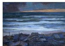
『無題』 上越市立戸野目小学校 所蔵