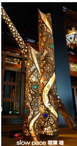
slow pace 稲葉 稔