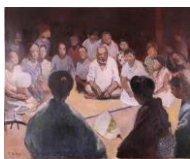
『藝女宿の美しい』 小林古径記念美術館 所蔵