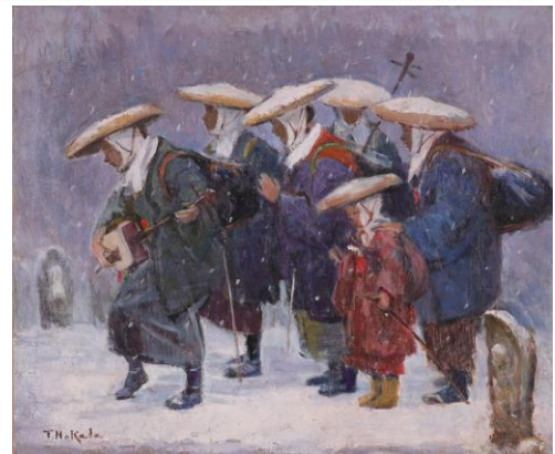
『藝女』小林古径記念美術館 所蔵