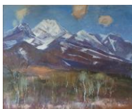
『妙高早春』 上越市立城北中学校 所蔵